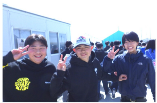
スマートフォン安全教室