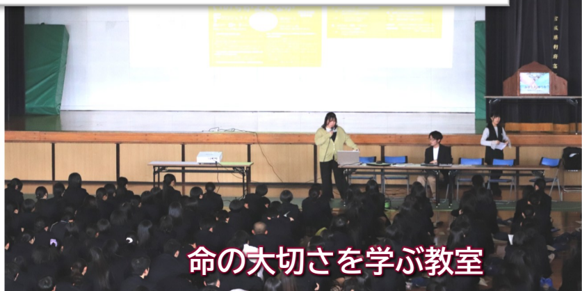
命の大切さを学ぶ教室