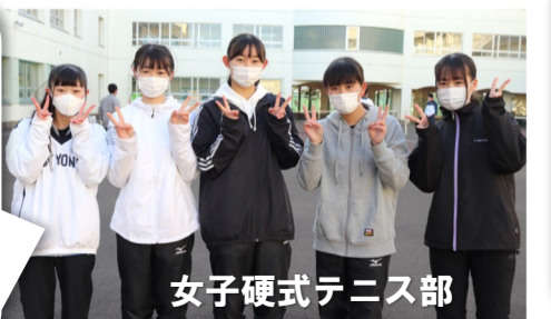
女子硬式テニス部

今までありがとうございました。 先輩方にたくさんのことを教えて 頂きとても感謝しています。 これからもテニス部一筋 頑張ります！