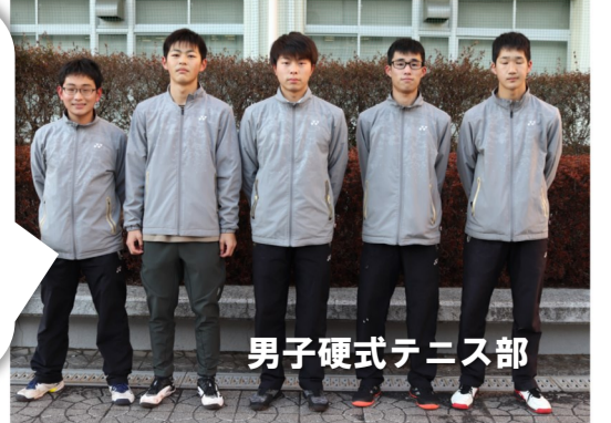
男子硬式テニス部