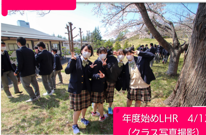
年度始めLHR 4/12 (クラス写真撮影)