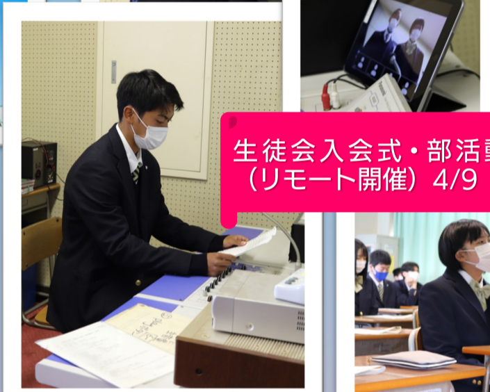
生徒会入会式・部活動紹介 (リモート開催) 4/9