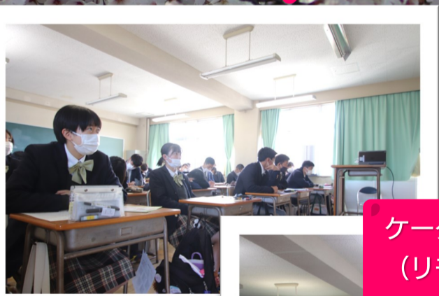
ケータイ・スマホ安全教室 (リモート開催) 4/21