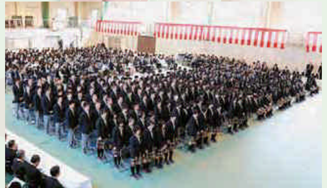
平成26年4月8日 入学式