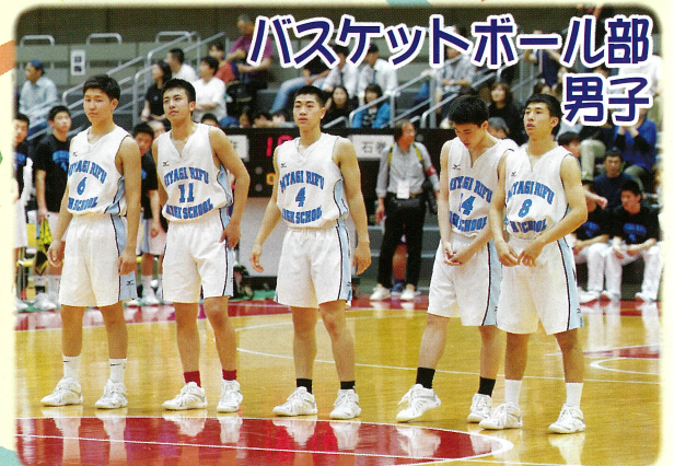
バスケットボール部 男子