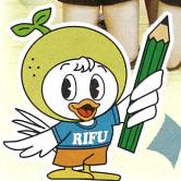
利府高校マスコット ペアリーフくん