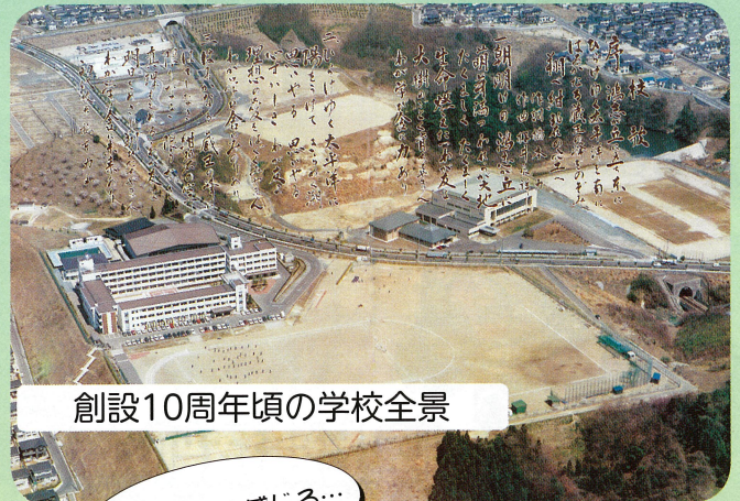
創設10周年頃の学校全景

あの頃は… ・開校当初の遠足は「県民の森」でした。 ・梨園花粉交配は、開校当初からの行事でした。