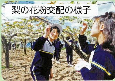
梨の花粉交配の様子