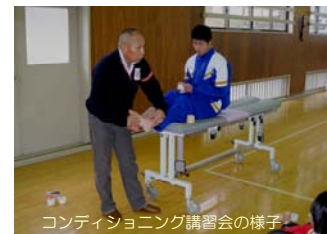
コンディショニング講習会の様子

全国を目指し自らの競技力の向上を図るだけでなく、スポーツを科学的に分析する力を養うとともに福祉関連の科目なども設定し、時代のニーズに合わせた体育・スポー指導者の育成を目指しています。専門科目においての先進的な取り組みや積極的に外部講師を活用した授業は全国でも注目されています。