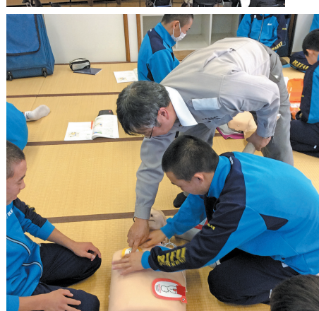
「救命講習会」などの体験を通し、消防士や自衛官など人を助ける業種の魅力に触れる

する運動部と同じ競技種目を学びます。自分の最も得意な種目を専門的に磨き、3年次に卒業論文にまとめ、発表します。