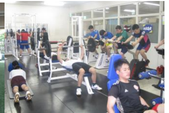
〈トレーニングルーム〉