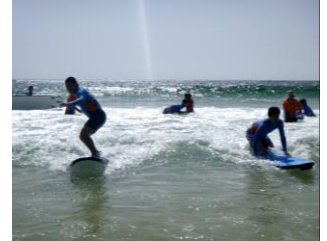
サーフレッスン(オーストラリア)

2年次が12月に行く修学旅行。近年の行き先は東北地方が中心でしたが、例年は、普通科は関西方面、スポーツ科学科はオーストラリアに行きます。宮城県とは違う土地で、また日本とは違う国で、様々な体験をし、文化や歴史など多くのことを学ぶ中で、一生の思い出を作れます。