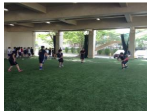
〈人工芝のピロティ〉