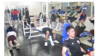
トレーニングルーム