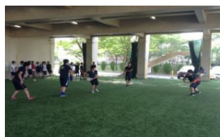
人工芝のピロティ