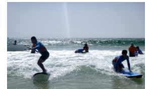
サーフレッスン(オーストラリア)

2年次が12月に行く修学旅行。利府高校では例年、普通科は関西方面、スポーツ科学科はオーストラリアに行きます。宮城県とは違う土地で、また日本とは違う国で、様々な体験をし、文化や歴史など多くのことを学ぶ中で、一生の思い出を作ることができます。