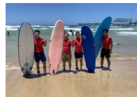
サーフレッスン(オーストラリア)

2年次が12月に行く修学旅行。利府高校では例年、普通科は関西方面スポーツ科学科はオーストラリアに行きます。宮城県とは違う土地で、また日本とは違う国で、様々な体験をし、文化や歴史など多くのことを学ぶ中で、一生の思い出を作ることができます。