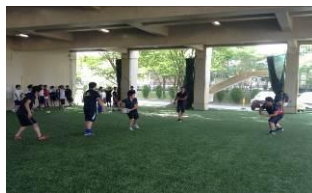
人工芝のピロティ